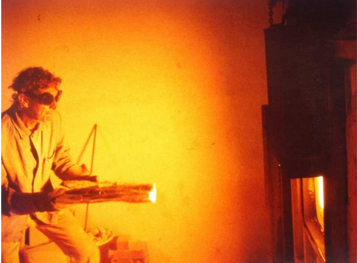
Le Maître du feu devant la bête